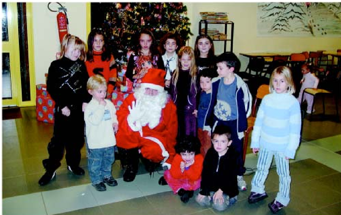
• Les enfants du personnel municipal avec le Père Noël

La période de Noël représente bien davantage qu'une grande fête liturgique. Au-delà de la magie de la Nativité, de l'attrait irrésistible des enfants pour la houppelande rouge, des festins nocturnes, se répand ce sentiment diffus d'une réconciliation possible dans un avenir plus