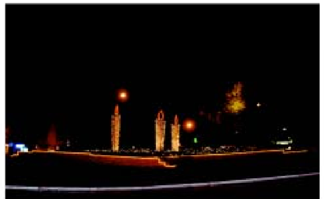
• Casamozza et le rond point Crocetta; les lumières de Noël