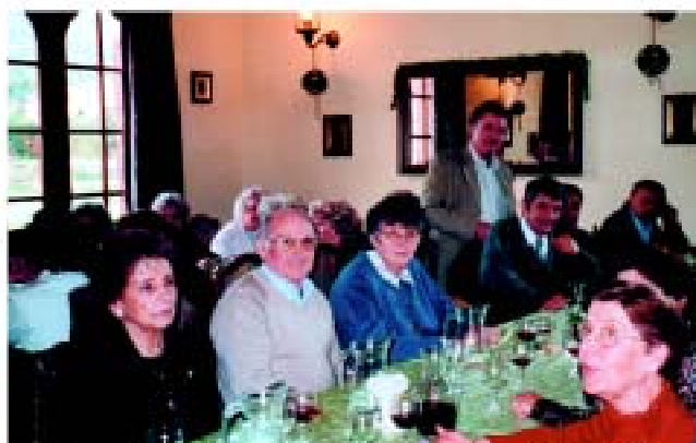
• Le repas du club des Aînés