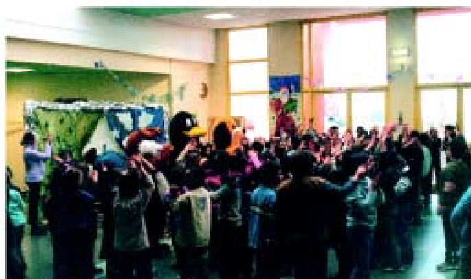
• Noël à l'école de Crocetta

fraternel. Le voeu est pieu mais y penser, c'est déjà commencer à vouloir le partager. Cette magie qui irrise les âmes, il faut bien la matérialiser. Sur la commune, elle a pris plusieurs formes: arbres de Noël pour lire le bonheur sur le visage des plus jeunes citoyens; repas et échange de cadeaux