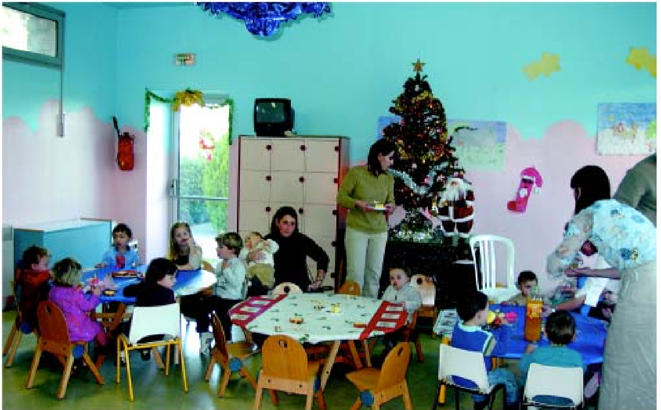
• Goûter de Noël à la Halte Garderie de Lucciana

des aînés au Castellu Rossu; illuminations dans tous ses quartiers, du village, qui prend l'apparence d'une crèche, à la cathédrale de la Canonica dont la façade flamboie. Force est de mettre ici en exergue le travail de l'équipe de la régie municipale qui a égrené cent-cinquante nouvelles déco-